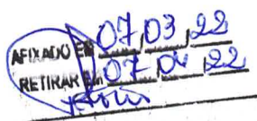
CUSTÓDIO RIBEIRO GARCIA PREFEITO MUNICIPAL

São Pedro da União, 07 de Março de 2022.